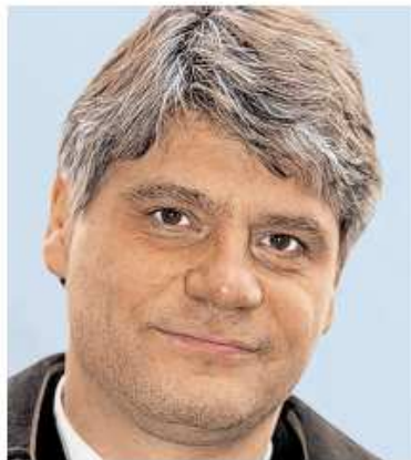
Raoul Schrott (l.) übertrug die „Ilias“ von Homer ins Deutsche.

Seit 2005 hat sich Schrott mit einer Neuübertragung oder Nachdichtung von Homers „Ilias“ beschäftigt, dieses Opus magnum erschien kürzlich zur Frankfurter Buchmesse. Also in unserer schnelllebigen Zeit gerade noch frisch genug, um im Heidelberger Deutsch-Amerikanischen Institut (DAI) mit einer langen Lesenacht unters Volk gebracht zu werden. Nach allerlei literaturkritischen Präliminarien zu seiner Transpositionstechnik („Ich wollte keine deutschen Hexameter“) ging es hinein ins volle Griechenleben. Raoul Schrott zieht dabei alle Register seiner Vortragskunst, immerhin gilt es darzustellen, dass die